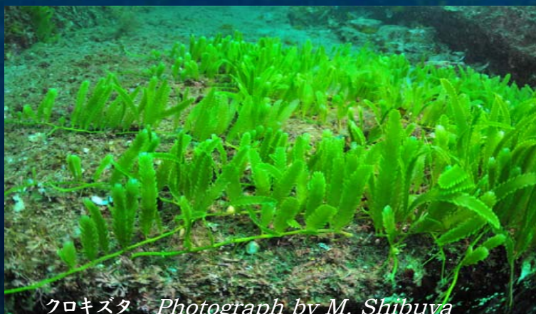
クロキスタ Photograph by M. Shibuya

1st Prize of 2 nd AMASOPS 2008: Photograph by R. Hosoya