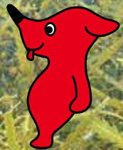
千葉県マスコット キャラクター 「チーバくん」